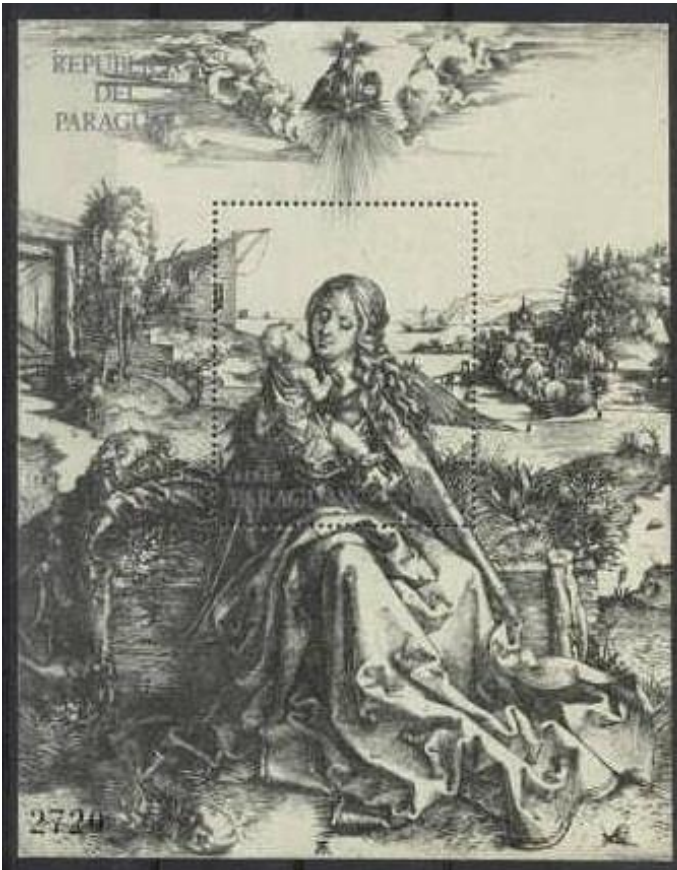
Albrecht Dürer als geloofsverkondiger.