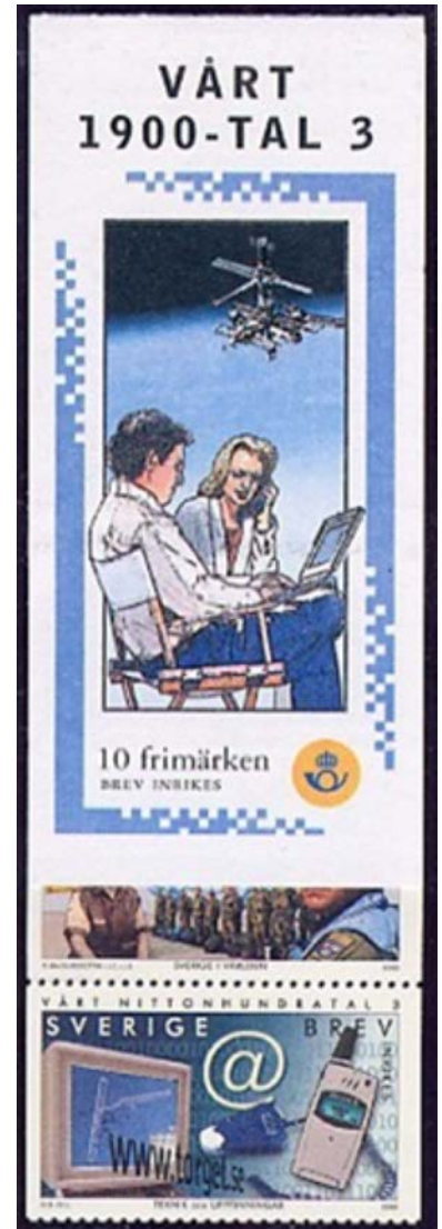
Zweeds postzegelboekje uit 2000 met laptop op schoot

Elke rasechte thematieker zal niet rusten voordat hij een nog toepasselijker element gevonden heeft.