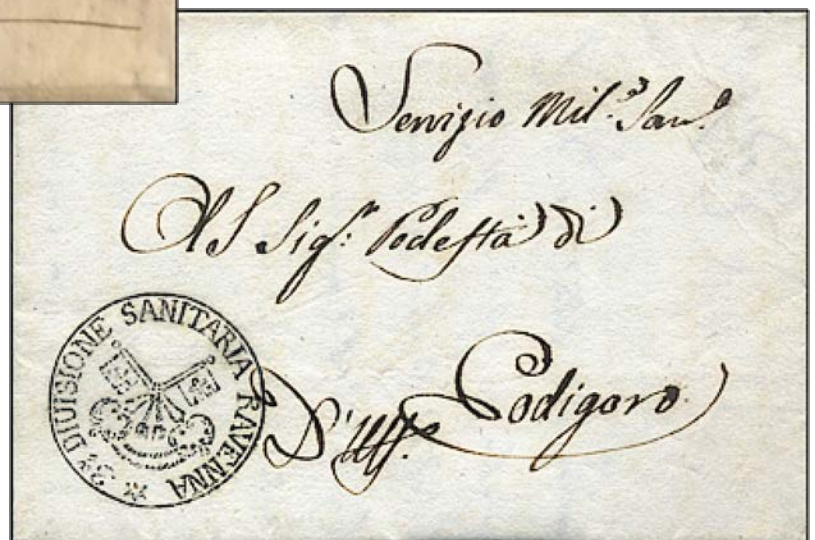
1816 - "d'Ufficio" brief van 'Il Commandante La 3. Divisione Sanitaria' verstuurd uit Ravenna naar Codigoro. Duidelijke 2 sleutels.

De voorfilatelistische merken beperken zich niet tot de enkele hiervoor vernoemd. De thematieker zal op zijn speurtochten in de literatuur, de veilingcatalogi, de ruilbeurzen en tentoonstellingen zeker interessante en nieuwe en andere ontdekkingen doen. De stukken in kwestie zijn 200 en meer jaar oud, hebben een graad van zeldzaamheid en zijn daardoor meestal niet goedkoop. Vooraleer over te gaan tot de aankoop van een voorfilatelistisch stuk moet goed overwogen worden welke - goede - plaats het krijgt in de verzameling. Het stuk dient thematisch iets bij te brengen, daar dient goed bij nagedacht te worden en vooral goed beschreven te worden. Een filatelistisch waardevol stuk verkeerd gebruikt mist elk effect.