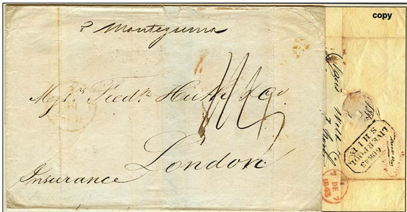
Verstuurd op 8 nov. 1843 in Havanna, via New York 20 nov. 1843, via Liverpool (merk) op 6 dec. 1843 aangekomen in London op 7 dec. 1843 (rood merk). Atlantische oversteek met schip Montezuma (genoemd naar Aztekenkeizer). Port is genoteerd als 1/4 = 1s\ 4d = 16d of dubbel port van 8d .

Het gebruik van deze POSTALE merken en stempels in een thematische verzameling is een bewijs van de filatelistische kennis van de verzamelaar. Er moet ook voor gezorgd worden dat het gebruik van het stuk werkelijk een aanvulling is van het verhaal. Een voorloper, het weze een filatelistisch juweel, kan evengoed storend werken. In een verzameling handelend over het Rode Kruis bijvoorbeeld, wordt de Slag bij Solferino (1859) niet geïllustreerd met een Année-brief van het Napoleonleger.