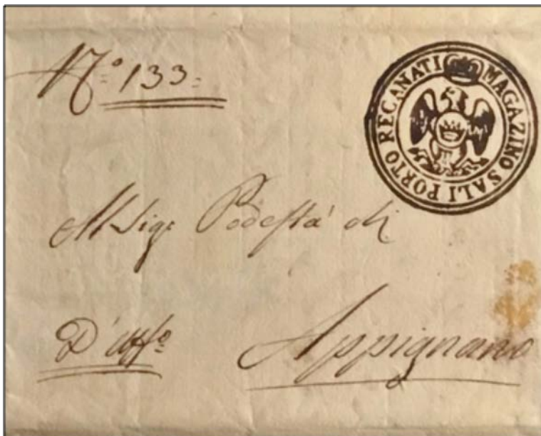
1814 - "d'Ufficio" brief verstuurd uit Recanati naar Appignano. In de stempel herkennen we een vogel. Arend of duif?