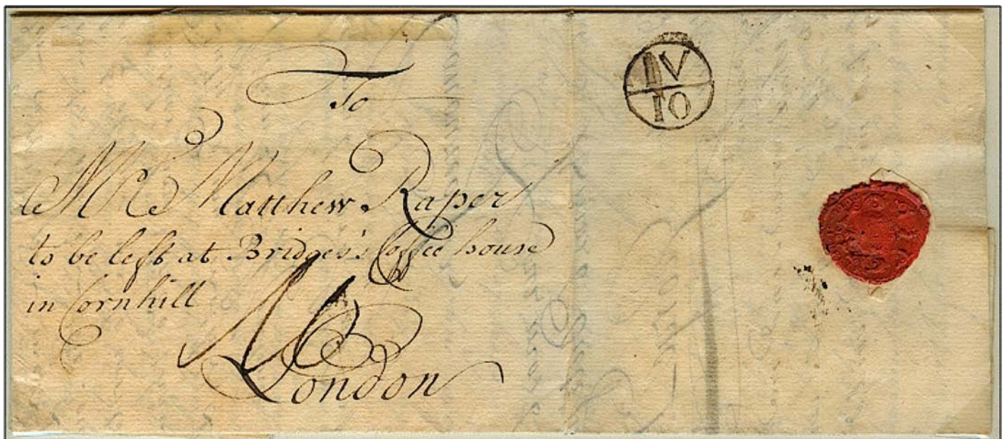
Bishopstempel van 4 oktober op brief verzonden in 1737 van Amsterdam (18 juni) naar 'Bridges' koffiehuis te London.

In de loop der jaren veranderden deze stempels meermaals: de vorm van letters en cijfers, later werd de cirkel groter en tenslotte kwam de dag bovenaan en de maand onderaan. De 'Bishop Mark' bleef in gebruik tot in 1787, dus meer dan 120 jaar.