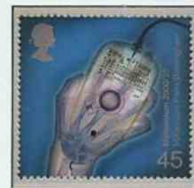
hidden rolling ball