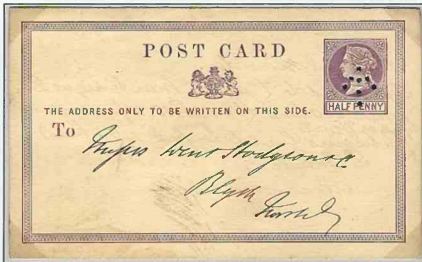
Early used 'Sloper arrow' cancel, Liverpool 1871.02.04 (Great Britain); used to speedup cancelation to cover massive sending of very popular card.

The best-known input device after the traditional keyboard is the "pointing device" - "mouse" in computer slang. It creates input by clicking selections on the screen. The motion of the pointer on a display can be any symbol like an arrow or a hand.