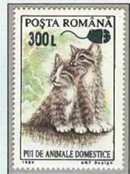
Overprint (Rumania) 300L on 90L dark green PC mouse symbol.

The best-known input device after the traditional keyboard is the "pointing device" - "mouse" in computer slang. It creates input by clicking selections on the screen. The motion of the pointer on a display can be any symbol like an arrow or a hand.