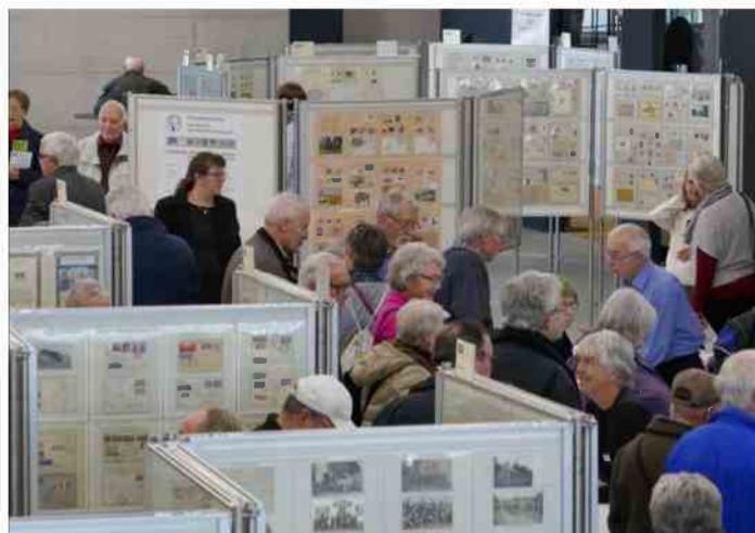
Jury aan het werk en bezoekers tussen de kaders

Een beginnende verzamelaar zoekt zijn weg in de technieken van het thematisch verzamelen. Deelnemen aan een tentoonstelling kost veel tijd en energie vooral als het de eerste keer is. Er moeten veel keuzes gemaakt worden en er rijzen evenveel vragen. Hoeveel kan ik tentoonstellen? Wat laat ik weg? Hoe breng ik het verhaal over op de bezoeker en de jury? Welke volgorde en opbouw van mijn materiaal kies ik. Allemaal vragen waarmee je geconfronteerd wordt als beginnende. De eerste keer lijkt het ook een scheve balans tussen het werk dat je er in stopt en het plezier dat je er uithaalt. We mogen niet vergeten dat een goed filatelist niet per definitie een goed tentoonsteller is. Verzamelen is een plezierige bezigheid en erover vertellen ook, maar als je hierover iets op papier moet zetten voor een tentoonstelling, lijkt het een corvee.