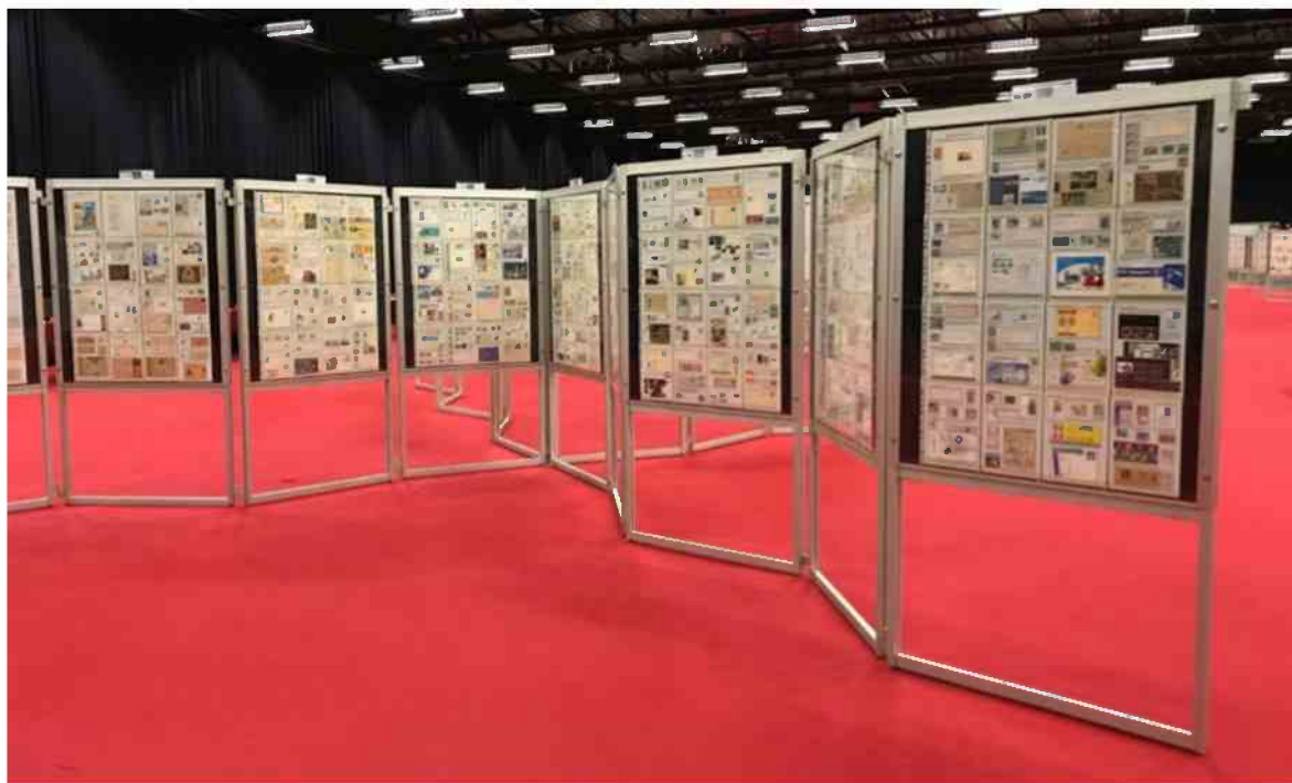
Verzameling op tentoonstelling te Philexnam 2018

Een en ander zou ook efficiënter kunnen vandaag als we kijken hoelang je verzameling op een tentoonstelling in de kijker loopt en hoeveel tijd in het opzetten van de verzameling wordt gestopt. Een verzameling die parallel op het internet kan tentoongesteld worden is laagdrempeliger en veel efficiënter. Je kan tentoonstellen aan iedereen die het wil zien. Er zijn niet langer tijds- of geografisch gebonden barrières, maar je tentoonstellingspresentatie is altijd en overal bereikbaar. De digitale wereld is onbegrensd. Door de huidige scanmogelijkheden kan je alles veel nauwkeuriger bekijken dan in het echt. Je bepaalt helemaal zelf wanneer en hoe lang je een kijkje neemt. De feedback kan ook gunstig uitpakken omdat je zo misschien in contact komt met collega-themaverzamelaars. En door de filatelie in een meer eigentijds jasje te steken, is de kans misschien groter om zo ook de jeugd meer aan te spreken.