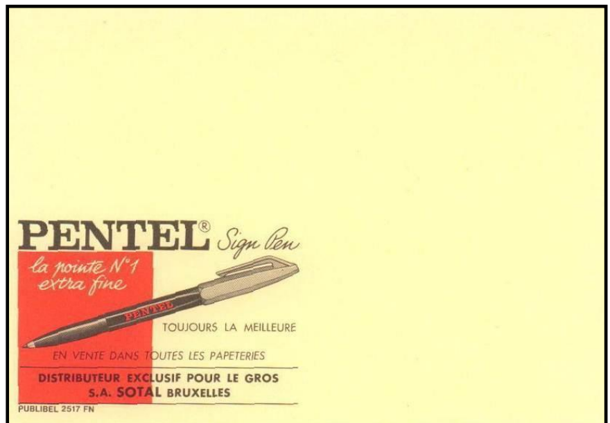
Albino publibel 2517; Pentel Pen