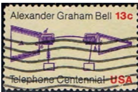
Afb. 4: golflijnen