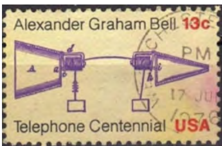
Afb. 5: betere keuze