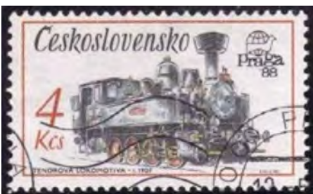
Afb. 6: cto-postzegel