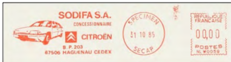
Afb. 2: Specimen

Over juiste frankeringen en vermelding ervan zullen we in een toekomstig HvTT uitvoerig hebben.