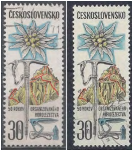
Afb. 3: gestempelde zegels

De Richtlijnen laten geen ruimte voor twijfel over de kwaliteit van cto-postzegels; 'Gezien het grotere belang dient de voorkeur gegeven te worden aan echt gestempelde stukken boven exemplaren die met massa-afstempeling ter verkoop komen'. De postzegel in afbeelding 6 heeft zo'n afstempeling. De herkenning van surrogaatzegels is doorgaans minder eenvoudig.