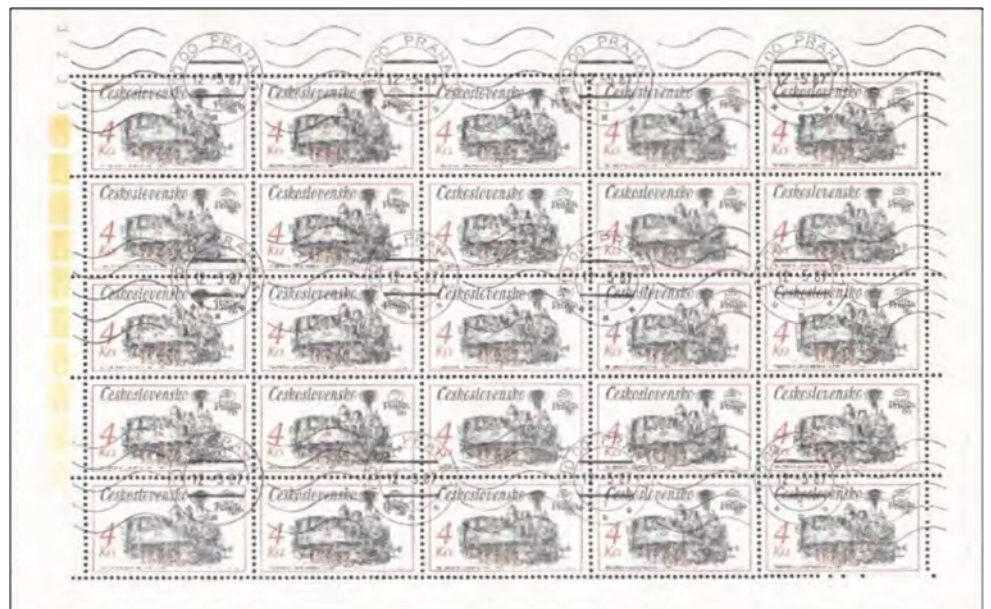
Afb. 7: massa-afstempeling