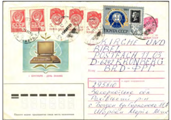
Afb. 11 & 12: Publibel en Russisch postwaardestuk

Nog meer kwaliteitsadviezen in het volgende HvTT.