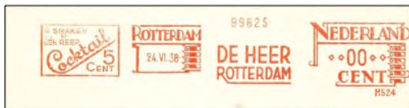
Afb. 1: 00-frankering

De eerste oefening voor het beoordelen van filatelistische kwaliteitsverschillen is hopelijk niet de moeilijkste. De frankeermachinestempel in afbeelding 1 oogt van zeer goede kwaliteit, maar de attente waarnemer merkt op dat de porto-instelling '00' volgens de richtlijnen ongewenst is. De Richtlijnen bevelen enkel brieven of 'rode meters' met juiste frankering aan. De uitzonderingen op deze voorkeursregel vormen specimen-afdrukken (afbeelding 2) en poststukken waarbij sprake is van een gerechtvaardigde postale reden. Specimen-afstempelingen, mits van serieuze herkomst, misstaan nooit in een thematische verzameling.