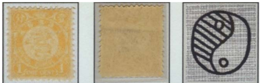
Watermerk op kleine draak (China – 1897); Yin- en Yang-symbool

Het Watermerk: Kan een zeer interessant element zijn als het klaar en duidelijk naar voor komt. Liefst alléén deze watermerken gebruiken die relevant zijn voor de behandeling van het thema. Watermerken met een afbeelding die zich over meerdere zegels verdelen dienen volledig getoond te worden. Er geen onduidelijke watermerken bijleuren of anders een tekening erbij plaatsen die het watermerk uitbeelden.