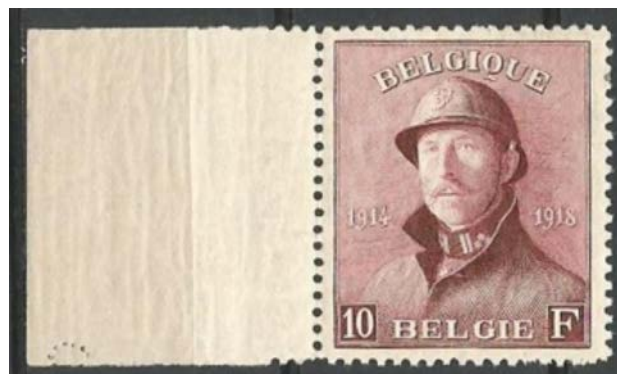
Variëteit Albert I met helm - 'sigaret achter het oor'

Kleur en andere variëteiten: Variëteiten, die zo waardevol zijn voor een traditionele verzameling, zijn in een thematische verzameling van minder belang. In enkele uitzonderlijke gevallen kan het opnemen van variëteiten de filatelistische kennis bewijzen. Ook krijgen sommige variëteiten een naam, zoals bijv. De Belgische postzegel van Albert I met helm waar de witte stip aan zijn oor 'sigaret achter het oor' wordt genoemd.