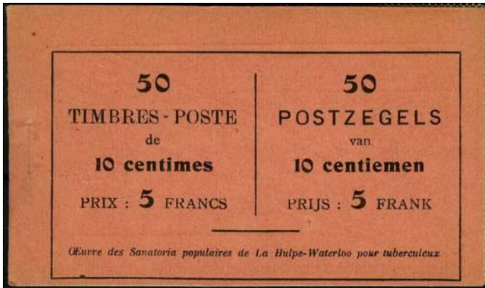
Nr. 15b rode kaft met zwarte tekst 50 x 10c

Laten we hier als voorbeeld postzegelboekje 15b nemen.