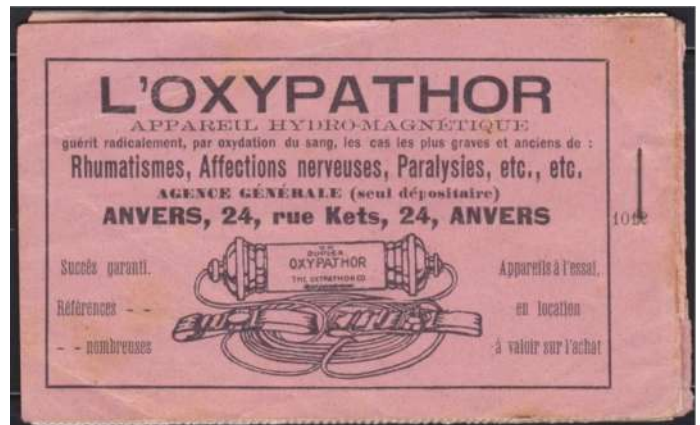
L'Oxypathor - geneeskunde (kwakzalverij)

Wat stel je vast ondanks het catalogusnummer 15b? Hier zie je, ondanks eenzelfde catalogusnummer, 5 verschillende reclames op de achterzijde van de kaft. Naast het nietje staat een getal uit vier cijfers: (van boven naar onder, links naar rechts) 1014, 1004, 1011, 1015, 1012. Ik heb tot op heden geen volledige lijst gezien met alle nummers die bestaan en de gerelateerde reclame. Iemand wel? Welke nummers bestaan er nog?