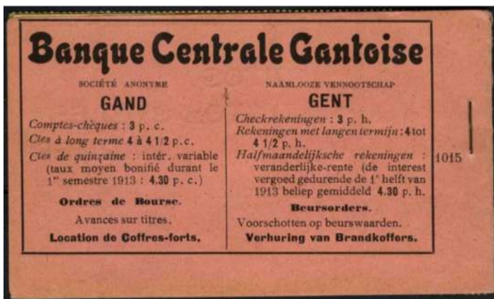
Banque Centrale Gantoise - de Gentse centrale bank