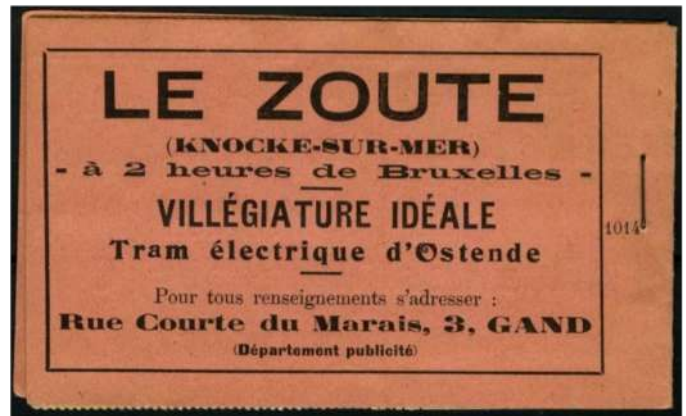
Le Zoute (Knocke-sur-Mer) - elektrische tram