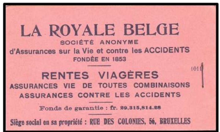
La Royale Belge - verzekeringen en ongevallen