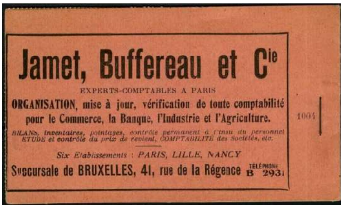
Jamet, Buffereau et Cie - boekhouding industrie en landbouw