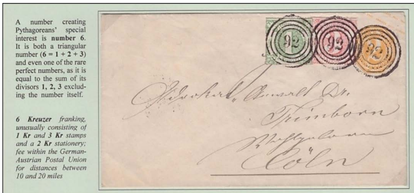
Voorbeeld van tariefbespreking uit verzameling 'wiskunde' van Joachim Maas

Meer dan 25 jaar geleden werd het handboek " The Philatelic Elements in Thematic Exhibits " van Michele Picardi gepubliceerd; het is een mijlpaal voor de meeste hedendaagse thematische tentoonstellers. In dat basiswerk documenteerde en beschreef hij verschillende poststukken, waarbij hij de juiste tarieven uitlegde voor de (aangetekende) brieven. Maar hoewel er hele goede voorbeelden van correcte tarieven werden getoond, die ook vanuit thematisch oogpunt zeer valide waren, uitte hij toch enige scepsis over de mogelijkheid en de noodzaak om al die frankering van de brieven te analyseren en te beschrijven. Hij vroeg zich af: "Hoe kan je dit allemaal weten en hoe kun je al deze talloze variaties onthouden? Dat is onmogelijk en het is zeer moeilijk! Het is gewoonweg onmogelijk als we het onderzoek uitbreiden van ons eigen land naar de hele wereld, met de vele tariefwijzigingen door de jaren heen", en daar bovenop de moeilijkheid voor juryleden om de tarieven te kennen en ze vervolgens te kunnen verifiëren tijdens het jureren.